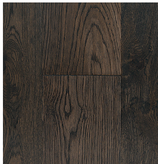
PEARL (LUSTRE MAT)

Le fini Pearl possède un lustre mat qui tend à dissimuler davantage l'usure normale du quotidien.