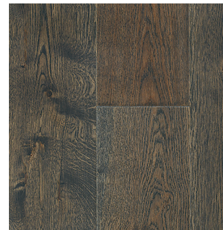
HUILÉ UV À BASE D'URÉTHANE (ULTRA-MAT)

Le fini Huilé UV est le fini le plus mat offert par Vintage et est tout indiqué pour les zones très achalandées. Grâce à sa formule développée par Vintage, l'huile UV à base d'uréthane propose le look européen des planchers huilés tout en offrant les avantages du resurfaçage qui caractérise l'uréthane.